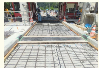
ロードヒーティング改修工事のイメージ